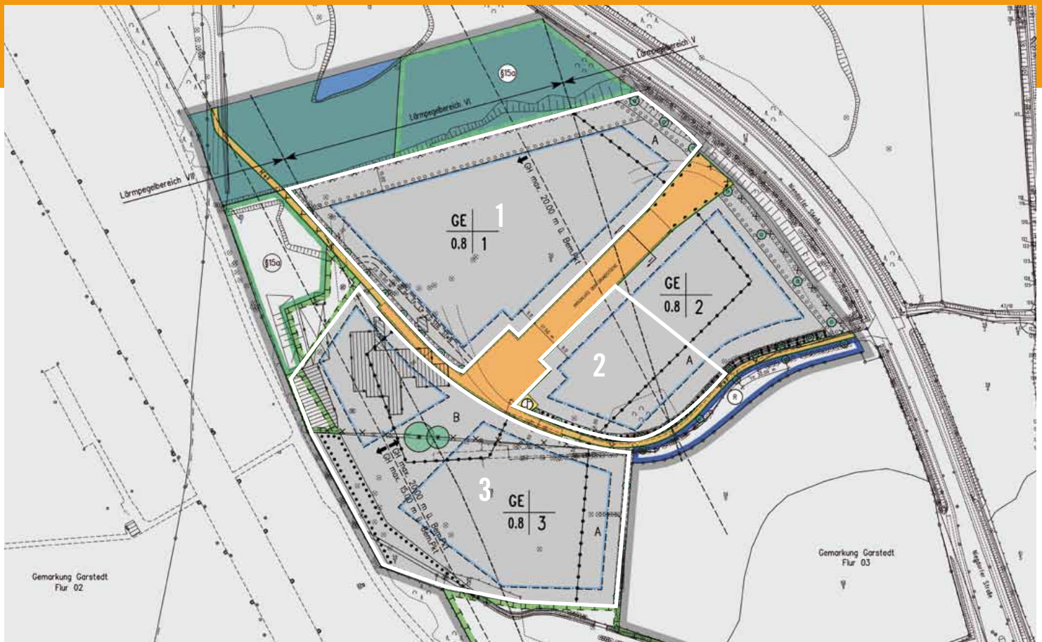
Blick von oben: Die drei Gewerbeflächen liegen im Bereich des Bebauungsplans 242.