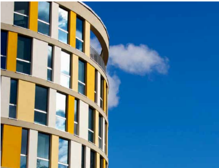
Hochwertiger Bürostandort: Die angebotenen Flächen liegen direkt neben den NORDPORT Towers im Südportal

Im „Südportal“ des NORDPORT bieten wir zukunftsorientierten Unternehmen attraktive Flächen für die Bebauung mit hochwertigen Bürogebäuden an. Das „Südportal“ an der Niendorfer Straße ist Standort der NORDPORT Towers und bildet in exponierter Lage das südliche Eingangstor der Stadt Norderstedt.