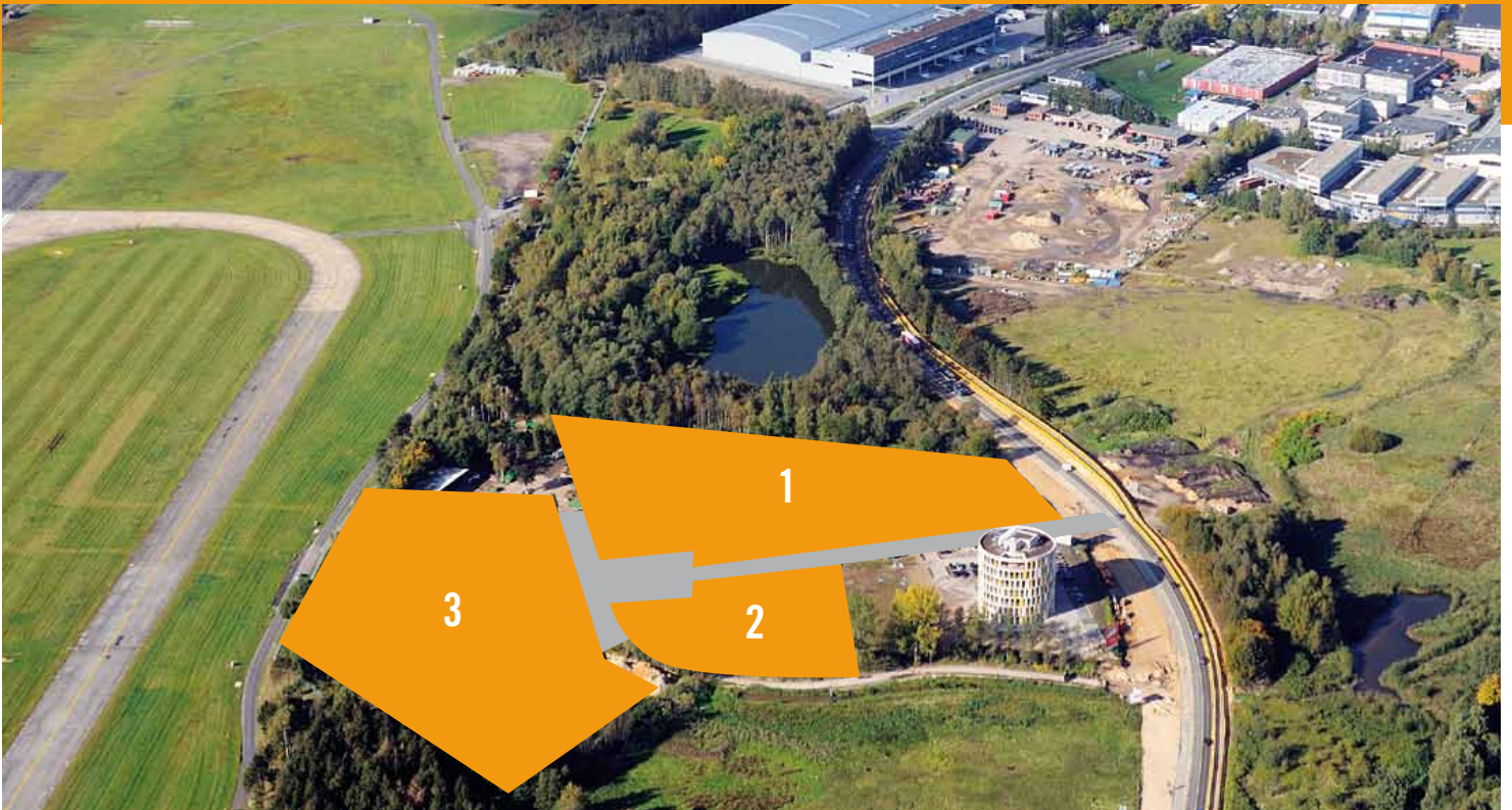
Blick aus Südosten auf die Bauflächen für Bürogebäude im Südportal an der Niendorfer Straße.