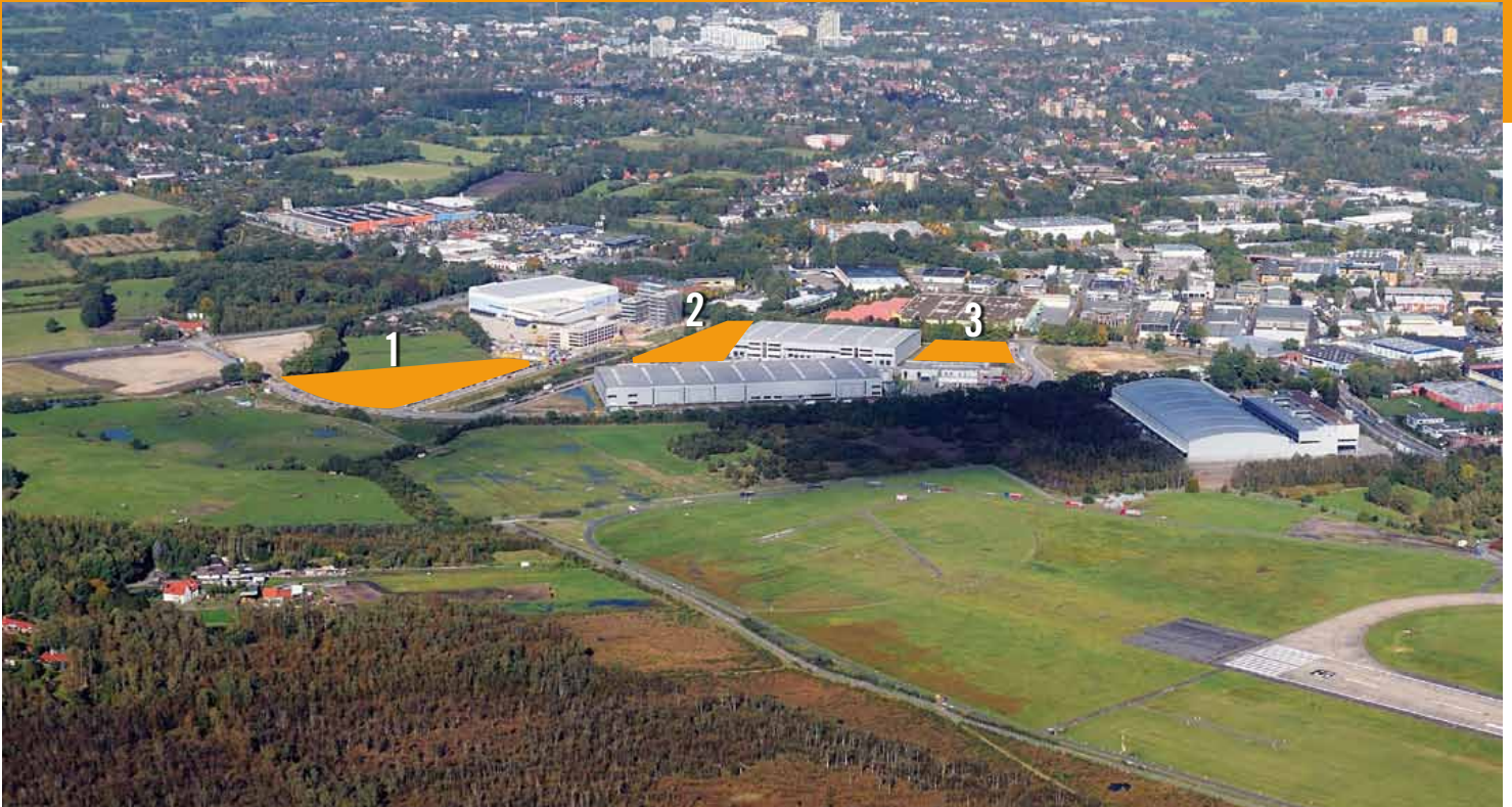
Blick von Süden auf die drei bebaubaren Flächen im Herzen des NORDPORT direkt an der Niendorfer Straße.